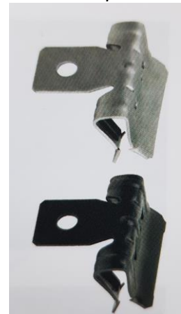
Zdjęcie produktu / Product photo